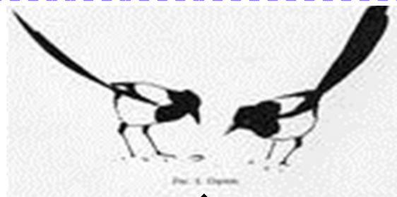
Рис. В. Смирнов